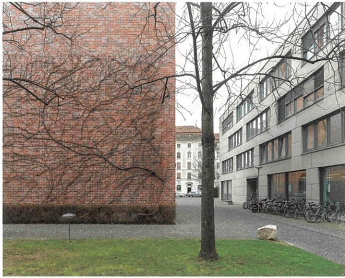
(2) PROJECT: WARTECK AREAL ARCHITECT: DIENER & DIENER ARCHITEKTEN LOCATION & YEAR: BASEL (BS), 1992-1996