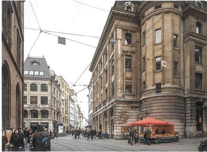
(3) PROJECT: NEAR THE MAIN POST LOCATION: BASEL (BS)