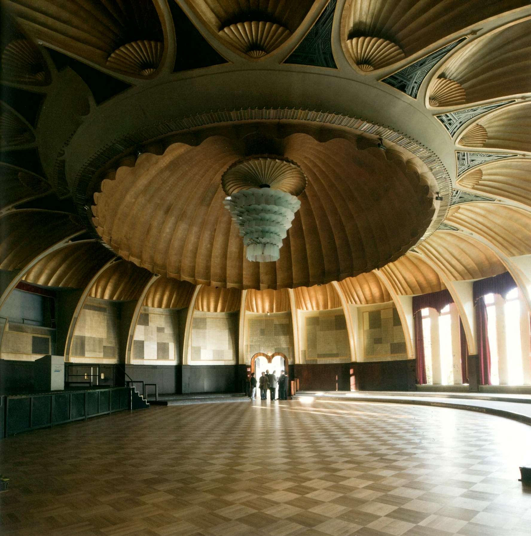
^Nach der Debatte: der Rheingoldsaal in Düsseldorf, 1926 von Wilhelm Kreis gebaut.