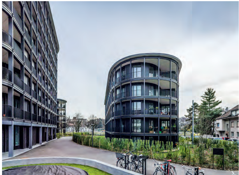
Die Wohnbebauung am Schaffhauser Rheinweg vom Basler Architekturbüro jessenvollenweider wurde Ende 2014 fertiggestellt.