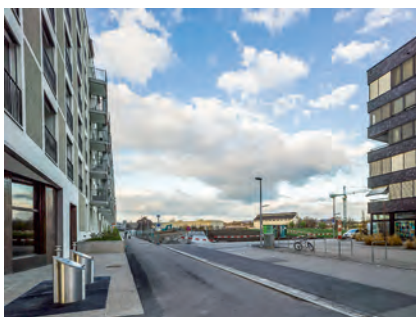
Erlenmatt-Areal : Die Planung im Westen ist mit einer Neubebauung im grossen Massstab abgeschlossen. Für den östlichen Teil sind kleinteiligere Strukturen vorgesehen. Kann dieses Areal, dessen Aussenraumanteil gegenüber den Baumassen überproportional erscheint, so einen städtischen Charakter erhalten?