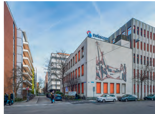
Das Rosental-Areal ist ein wichtiges Bindeglied zwischen dem Badischen Bahnhof und der Innenstadt, doch der Verkauf des Syngenta-Areals blockiert die zukünftige Entwicklung – eine verpasste Chance.

Das historische Matthäusquartier als Modell für eine hoch verdichtete Stadt mit kleinteiliger Parzellenstruktur: ein aktives Quartier mit stetigem Wandel im Kleinen und vielen neuen Impulsen – eine Referenz für künftige Arealentwicklungen?