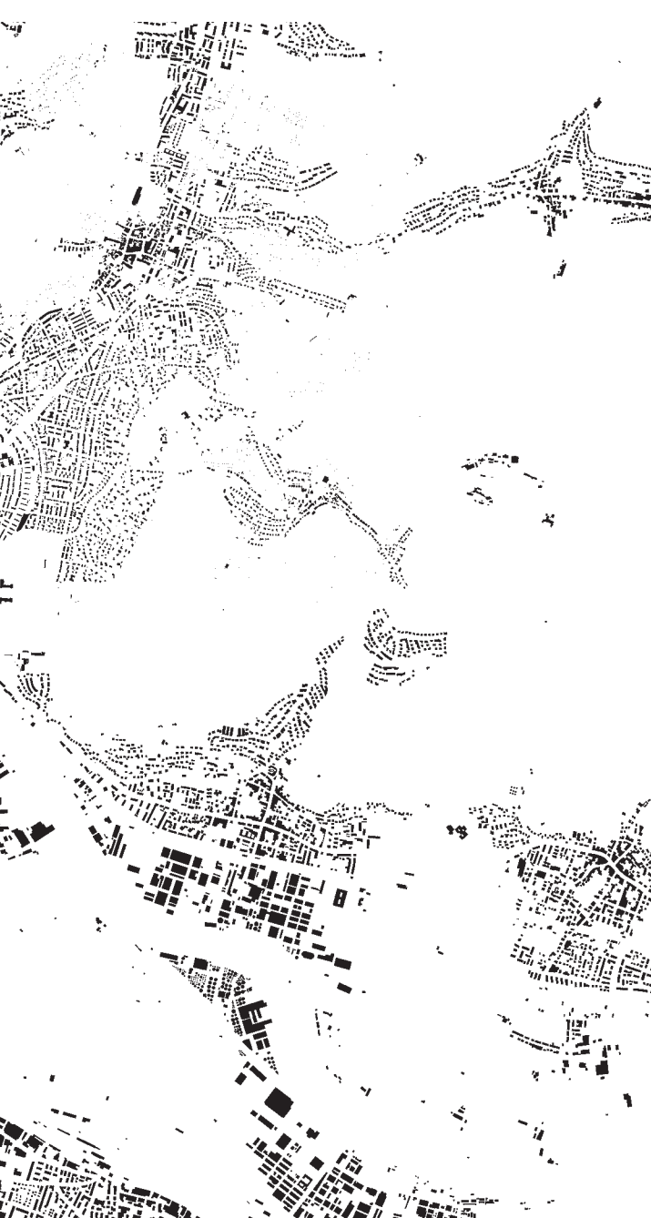
Schwarzplan: Bau- und Verkehrsdepartement Kanton Basel-Stadt, Städtebau & Architektur, Planungsamt

31 Dreispitz-Areal: Christoph Merian Stiftung (Bauherrschaft), Quartierentwicklung auf Basis des 2002 von Herzog & de Meuron erarbeiteten Stadtentwicklungsprojekts, vgl. TEC21 3-4/2003.