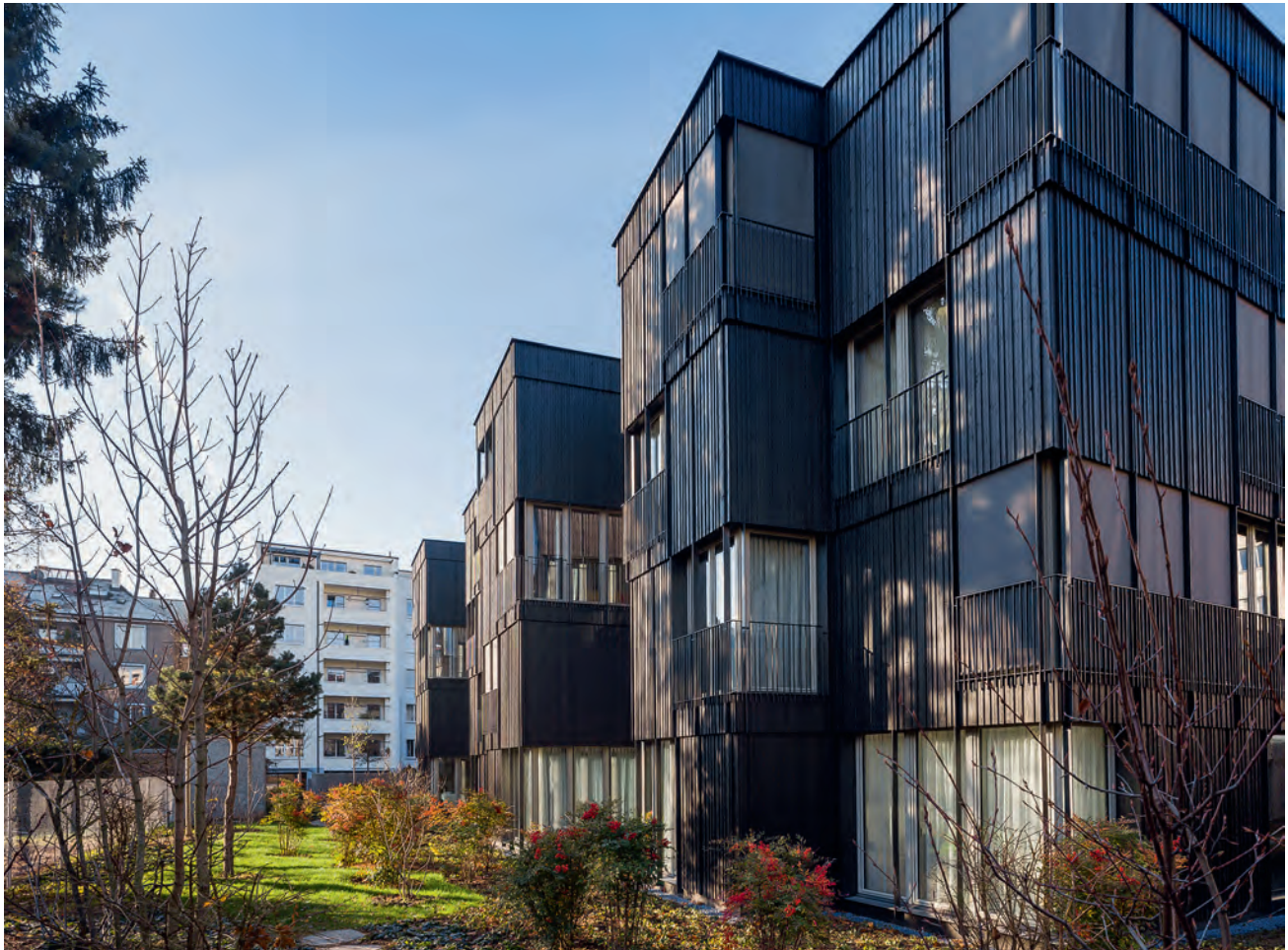
«Verdichten nach innen» – die Hofbebauung von Miller&Maranta in einem Blockrand an der Sempacherstrasse inmitten des Gundeldinger Quartiers schafft Intimität im Hof mit einer raffinierten Grundriss- und Schnittidee.