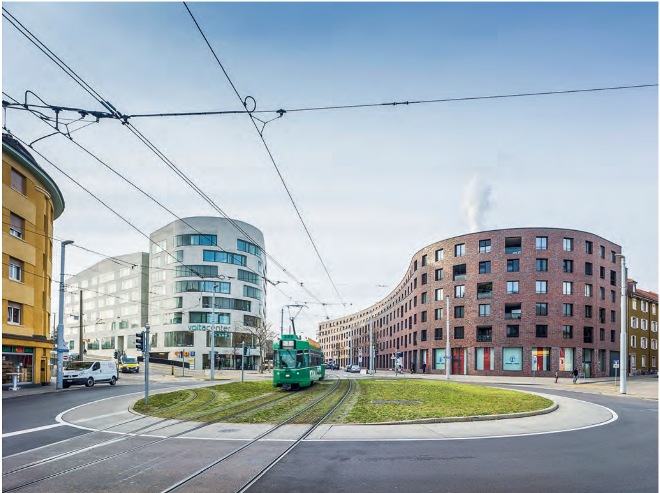
Ein Stück Stadt: das Volta-Areal . Das Infrastrukturprojekt Nordtangente hat hier eine Chance für die Stadtentwicklung eröffnet, die auch genutzt wurde.