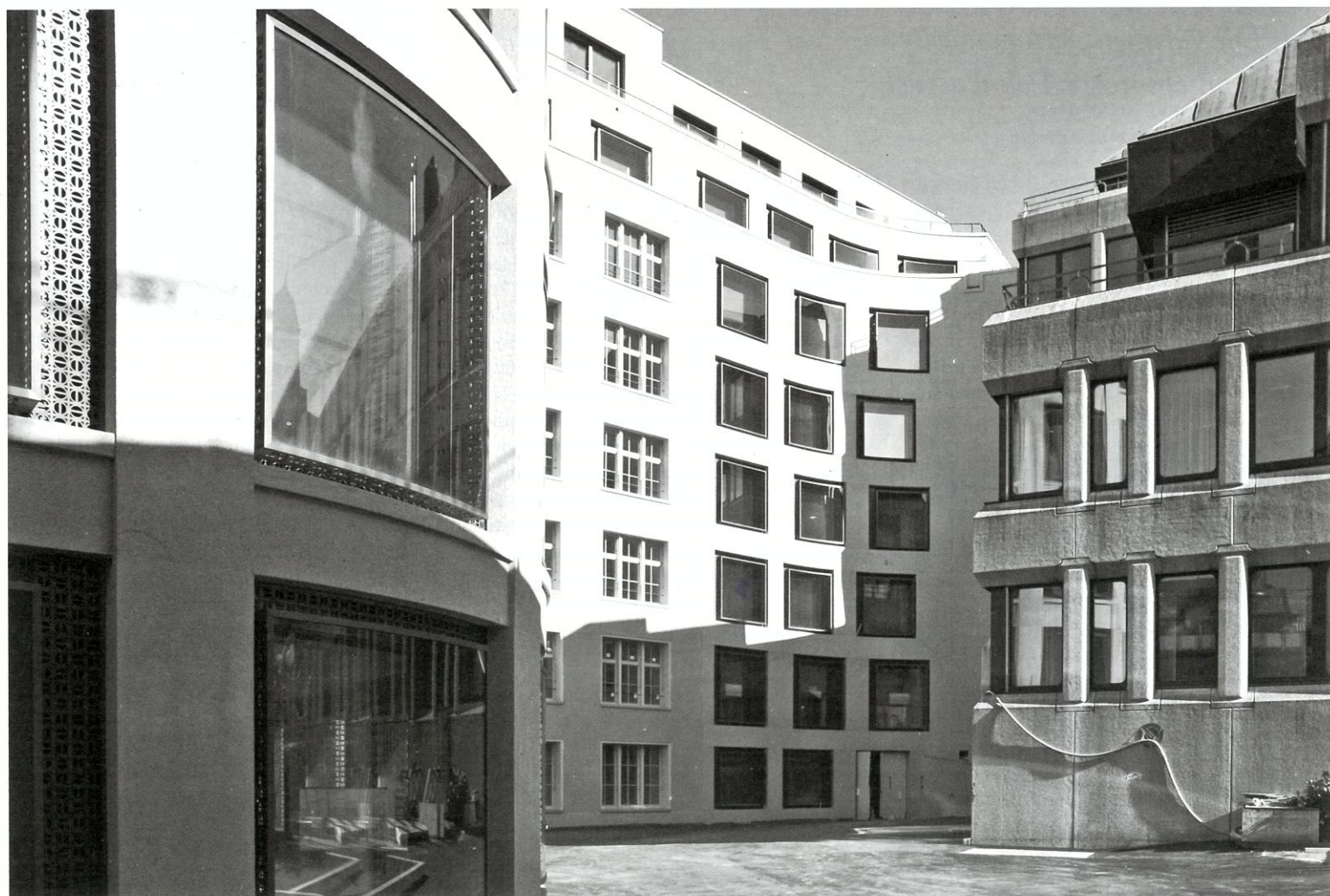
Gut eingefügt: das Verwaltungsgebäude von Jessen Vollenweider, Ansicht von hinten, rechts das alte UBS-Gebäude.

In ihrer Erscheinung stehen die neuen Gebäude in der Tradition der steinernen Geschäftshäuser aus der Entstehungszeit des Quartiers. Die Formate der Fenster sind von den beiden stattlichen Altbauten am Oberen Graben übernommen. Man sieht ihren gestockten Fassaden die Handarbeit an, derer es bedurfte, um der glatten Oberfläche des Betons eine lebendige Textur abzurufen. Das Ornament der historischen Vorbilder ist nicht verschwunden, es hat sich lediglich in die Fugen rund um die Fensterrahmen zurückgezogen, wo es in Baubronze gefertigt die grossen Kastenfenster rahmt und einen Lüf-